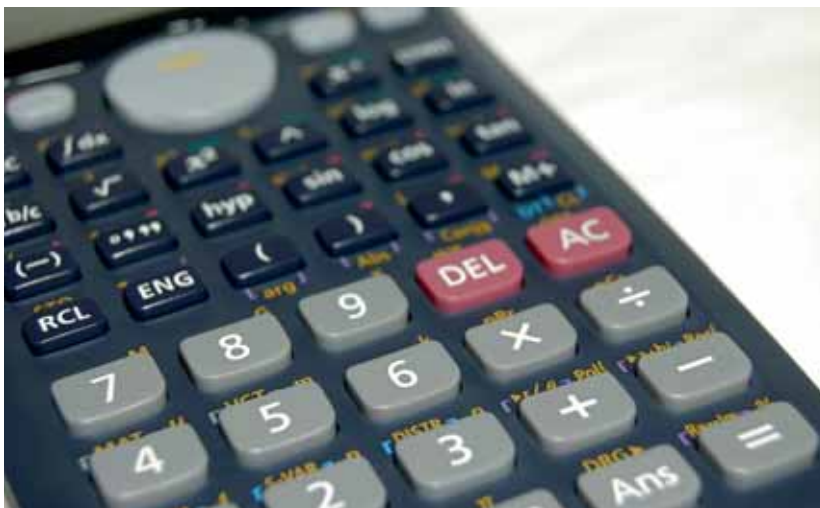
Slimme bijtellingstruc afgekeurd

Een ongevallenuitkering is niet altijd onbelast. Het Hof Arnhem boog zich onlangs over de fiscale status van een kapitaalsuitkering voor een lid van de vrijwillige brandweer, die ernstig schouderletsel had opgelopen bij een voetbaltoernooi van zijn brandweerteam. Daarvoor ontving hij van de gemeente een kapitaalsuitkering van € 125.000 waarop bijna € 65.000 belasting was ingehouden. Het Hof Arnhem vond die inhouding terecht omdat de man zijn werk in een publiekrechtelijke dienstbetrekking verrichtte, waarvoor de arbeidsvoorwaarden golden zoals opgenomen in de Rechtspositieregeling vrijwilligers bij de brandweer van deze gemeente. Het Hof stelde dat de uitkering door deze bijzondere omstandigheid (zoals