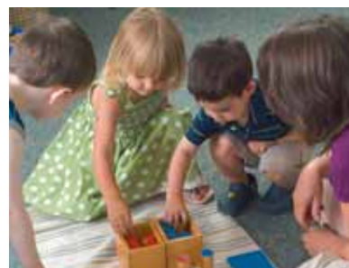
Gastouder moet geregistreerd staan voor toeslag

Maakt u gebruik van gastouderopvang, en wilt u in aanmerking komen voor kinderopvangtoeslag, dan moet uw gastouder vanaf 1 januari van dit jaar geregistreerd zijn in het Landelijk Register Kinderopvang. Staat uw gastouder daar niet geregistreerd, dan moet u zelf