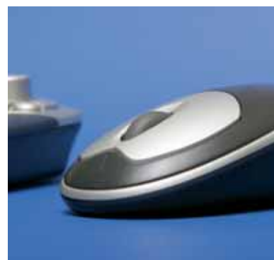
RSI-schade verjaart na vijf jaar

Werknemers kunnen hun werkgever aansprakelijk stellen voor schade door RSI-klachten die het gevolg zijn van het werk. Dat moet echter wel binnen vijf jaar gebeuren, zo heeft de Hoge Raad