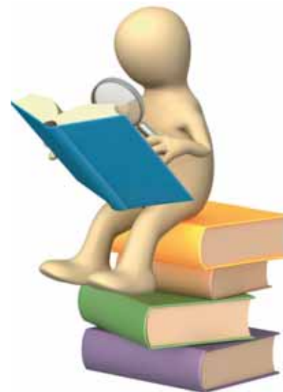
Speur- en ontwikkelingswerk niet overdraagbaar

Belastingplichtigen die recht hebben op de mkb-vrijstelling moeten dit bedrag aftrekken van het buitenlandse inkomen en van het wereldinkomen. Dat heeft de Rechtbank Haarlem onlangs bepaald in een zaak van een belastingplichtige die vond dat de mkb-vrijstelling alleen in aftrek hoeft te worden gebracht op het wereldinkomen (wat financieel voordeliger is).