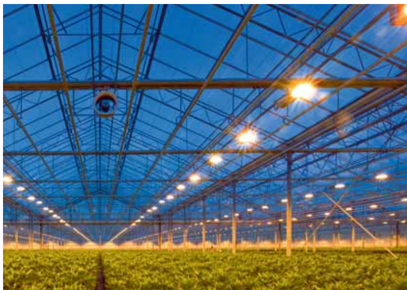
Niet insturen tuinbouwverklaring kostbare zaak

bedoeld in een eerder arrest van de Hoge Raad over deze situatie) bij het loon moest worden gerekend.